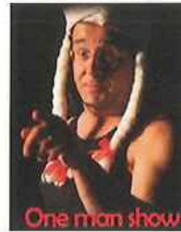
One man show

Pour plus de renseignements contactez Charlotte BESSON au 06 15 63 63 17