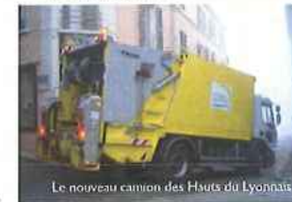
Le nouveau camion des Hauts du Lyonnais

Les déchèteries des Monts du Lyonnais : Elles sont gratuites pour les particuliers !